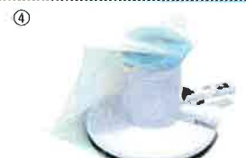
サンドバグガー…④ 本体寸法: 約25.2(径)x17cm(高)

様々なタイプのネットやブラシを取り揃えており、清掃用途に合わせてお選びいただけます。バグガーを含めて、全てのネットやブラシ(ハンドブラシを除く)、レスキューフックは、弊社取り扱いのポールを使用できます。