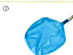
スキマーネットプロ…⑦ 耐久性を重視したアルミフレーム仕様で浮遊しているゴミをすくうことができます。網寸法:約34(幅)x37cm(長)