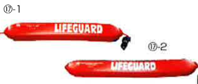
非常時に水中で溺れた人を救助する際に使用する器材です。ライフセービングチューブには身体に巻き付けるためのベルトとフックが付いていますが、ウォーターパークライフセービングチューブにはフックが付いていません。 ライフセービングチューブ…⑰-1 浮力帯寸法:約100(長)x14(幅)x7.5cm(厚) ウォーターパークライフセービングチューブ…⑰-2 浮力帯寸法:約125(長)x15(幅)x8.5cm(厚)