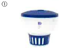
ケミカルフローター…① 本体寸法: 約16.9(本体上部径)x18.8cm(高)

蛇口の水圧を利用して、プールの底に溜まった沈殿物を吸い上げる手動式プールクリーナーです。対象となる沈殿物によりリーフバグガー（落ち葉など比較的大きな沈殿物）、サンドバグガー（砂など比較的小さい沈殿物）の二種類があります。全自動機が使用できないアイランドのあるプールや水温の高い浴槽などに最適です（ポール・水道ホースは別売）。