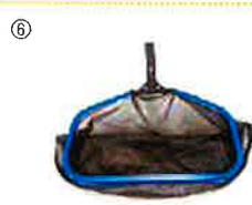
レーキネットプロ…⑥ 耐久性重視の業務用レーキネットです。 網寸法:46.2(幅)x20.9(長)x52.1cm(深)