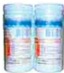
ソフピュアウォータークリーン…⑱ ジクロロイソシアヌル酸ナトリウムが主成分の衛生剤です。即溶解性なので水に投入すると速やかに溶けて、除菌・漂白・消臭効果を発揮します。内容量:錠剤20g x 50個/ボトル、顆粒1kg/ボトル