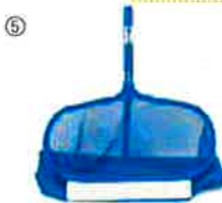
スーパー付レーキネットプロ…⑤ スーパー付きなので沈殿物を効率よく掻き集めることができます。網寸法: 46.9(幅)x18.1(長)x37cm(深)

様々なタイプのネットやブラシを取り揃えており、清掃用途に合わせてお選びいただけます。バグガーを含めて、全てのネットやブラシ(ハンドブラシを除く)、レスキューフックは、弊社取り扱いのポールを使用できます。