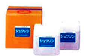
シュワリン…⑳ プールの壁面に染み込んだ水垢・黒い染みの汚れ、頑固に付着した藻類又は錆まで根こそぎ取るのできるプール清掃用洗剤です。プール本体を傷めず、塗装面の脱色や剥離もないため、シーズン始めの清掃に最適です。