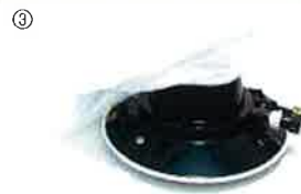
リーフバグガー…③ 本体寸法: 約38.5(径)x16cm(高)