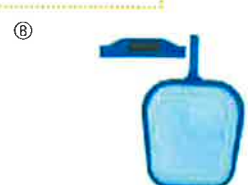
マグネット付スキマーネット…⑧ スキマーネットの先端に磁石が付いていますのでピン止めなどを水中で簡単に取り除くことができます。網寸法:約33(幅)x40cm(長)