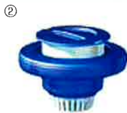
ポップアップケミカルフローター…② 本体寸法: 約21.5(本体上部径)x18.5cm(高)