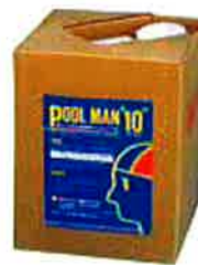
プールマン10…⑲ オフシーズンにプールの水の汚れを効果的に防止し、プール的美観を保つための防藻剤です。水生バクテリアや藻類の発生を抑制するので、シーズン始めの清掃がとて容易になります。