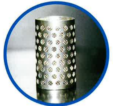
尿石防止剤（エコパワー）使用。