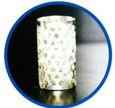
尿石防止剤（エコパワー）未使用。

男性用便器に尿石の付着状態の確認テストを1ヶ月間実施したところ、以下の通りの効果が得られました。